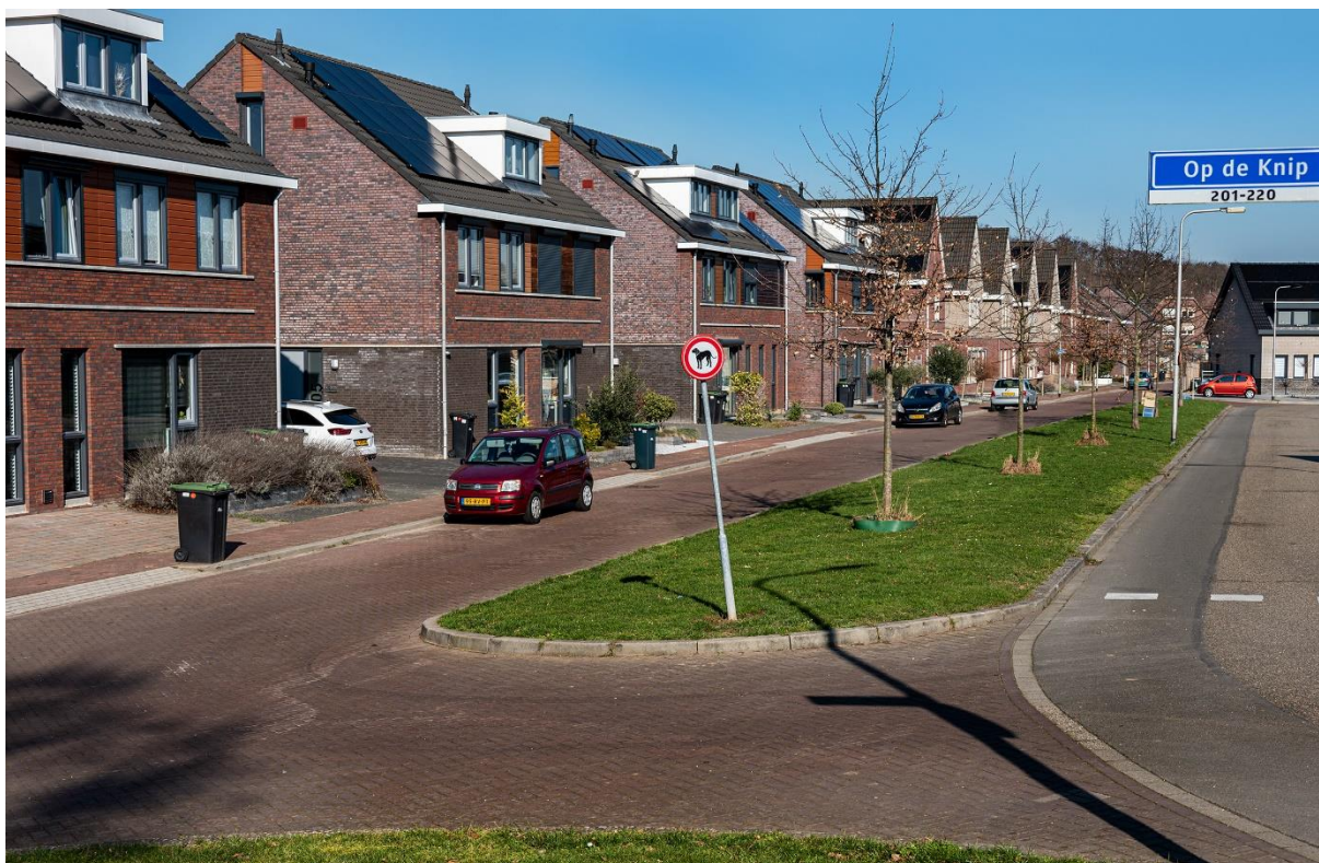
Op de Knip

Juist omdat vastgoed zo lang meegaat, is het zaak om bij alles wat wordt toegevoegd, afgebroken of veranderd, goed na te denken over de kwaliteit waar morgen vraag naar is. Naar de duurzaamheid van woningen en de woonomgeving en naar de mogelijkheden voor ander of flexibel gebruik. Rekening houden met nu en de toekomst gaat voor de Parkstadgemeenten over woningbouw die passend is voor de bewoners van nu en later en in materiaal- en energiegebruik duurzaam is. Deze woonvisie is daarmee voor de bewoners van nu, maar nadrukkelijk ook voor die van de toekomst.