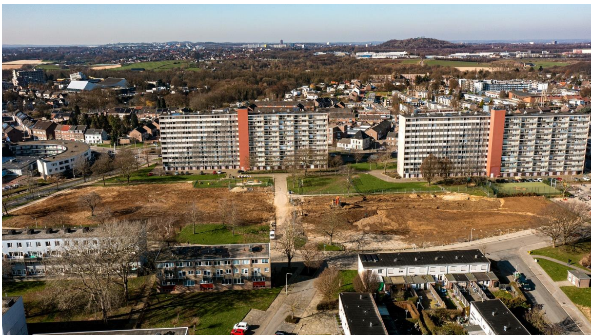
Herstructurering bij plangebied Rolduckerveld

De kansen om de woningvraag op te lossen binnen de bestaande bebouwing worden waar mogelijk benut. Bijvoorbeeld door het (levensloop) geschikt maken van woningen, het toestaan van verhuur van koopwoningen in de sociale en middeldure huurcategorie (onder voorwaarde dat dit geen slechte verhuurpraktijken in de hand werkt) en het transformeren van geschikt vastgoed naar woningen.