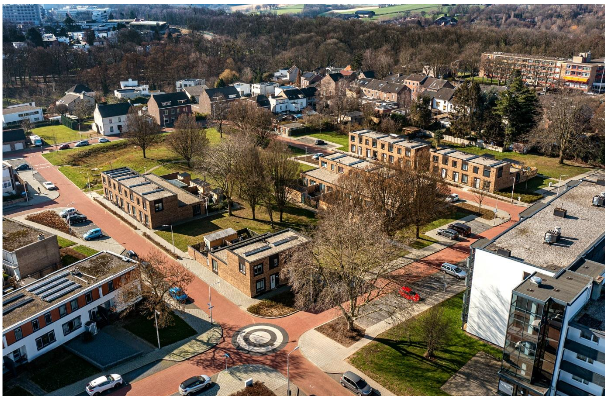
Sociale huurwoningen aan de Poyckstraat

Stijgende energieprijzen hebben op dit moment de grootste invloed op betaalbaarheid. In de regio Parkstad leeft op dit moment (2022) bijna tien procent van de mensen in energiearmoede. Alle gemeenten maken zich hier zorgen over en zetten lokaal beleid in voor energiebesparing en inkomensondersteuning. Door het duurzaamheidsdomein is regionaal het Verbond voor Energierichtvaardigheid gesloten tussen gemeenten, woningcorporaties en maatschappelijke partners met als doel om tot een betaalbare energierekening, een leefbare woonkamertemperatuur en een houdbare ecologische voetafdruk te komen.