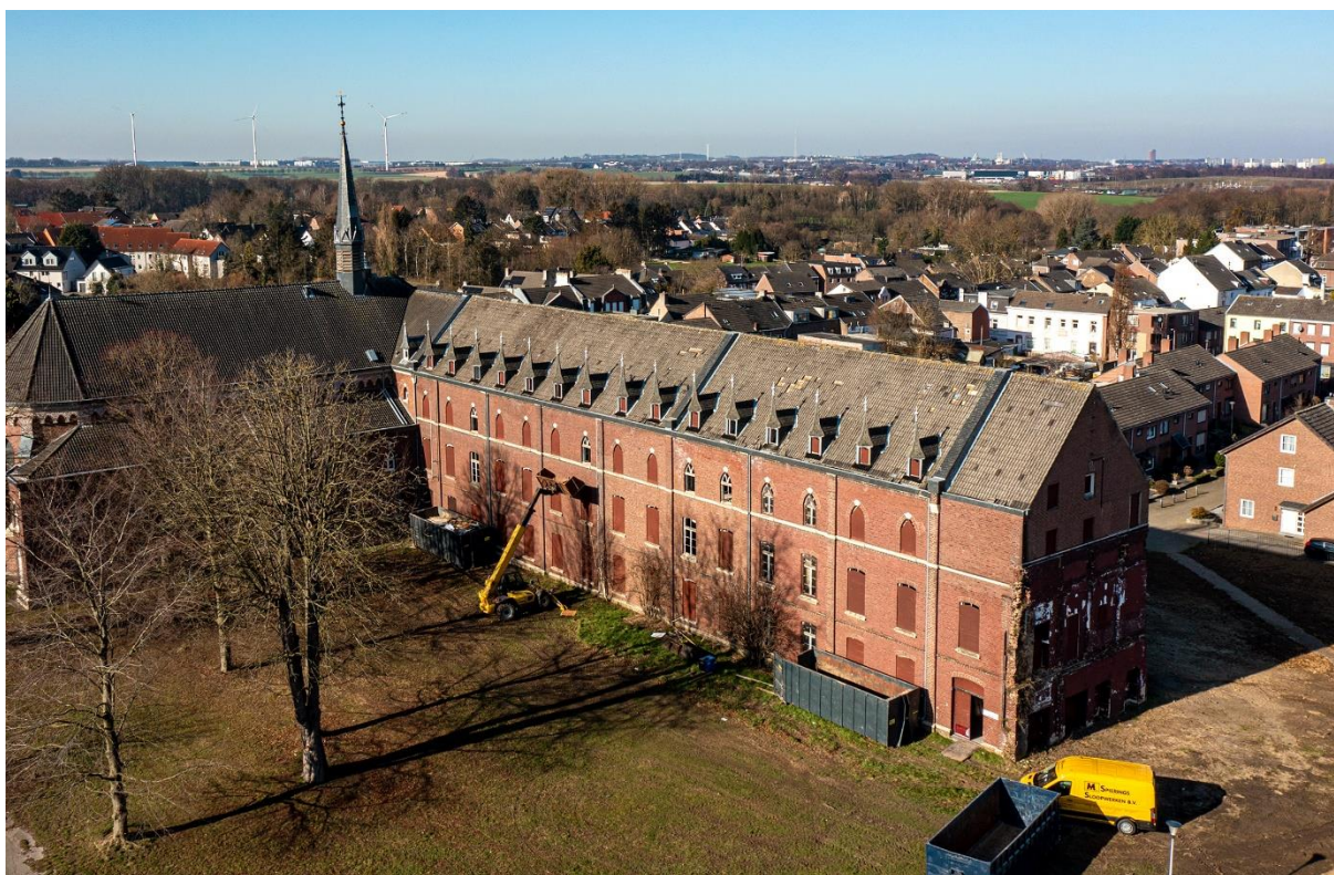
Verbouwing voormalig Klooster Pannesheide

Bij de aanpak van voormalige mijnwerkerswoningen (Rijksmonumenten) is er bijzondere aandacht voor het behoud van de identiteit van de wijken.