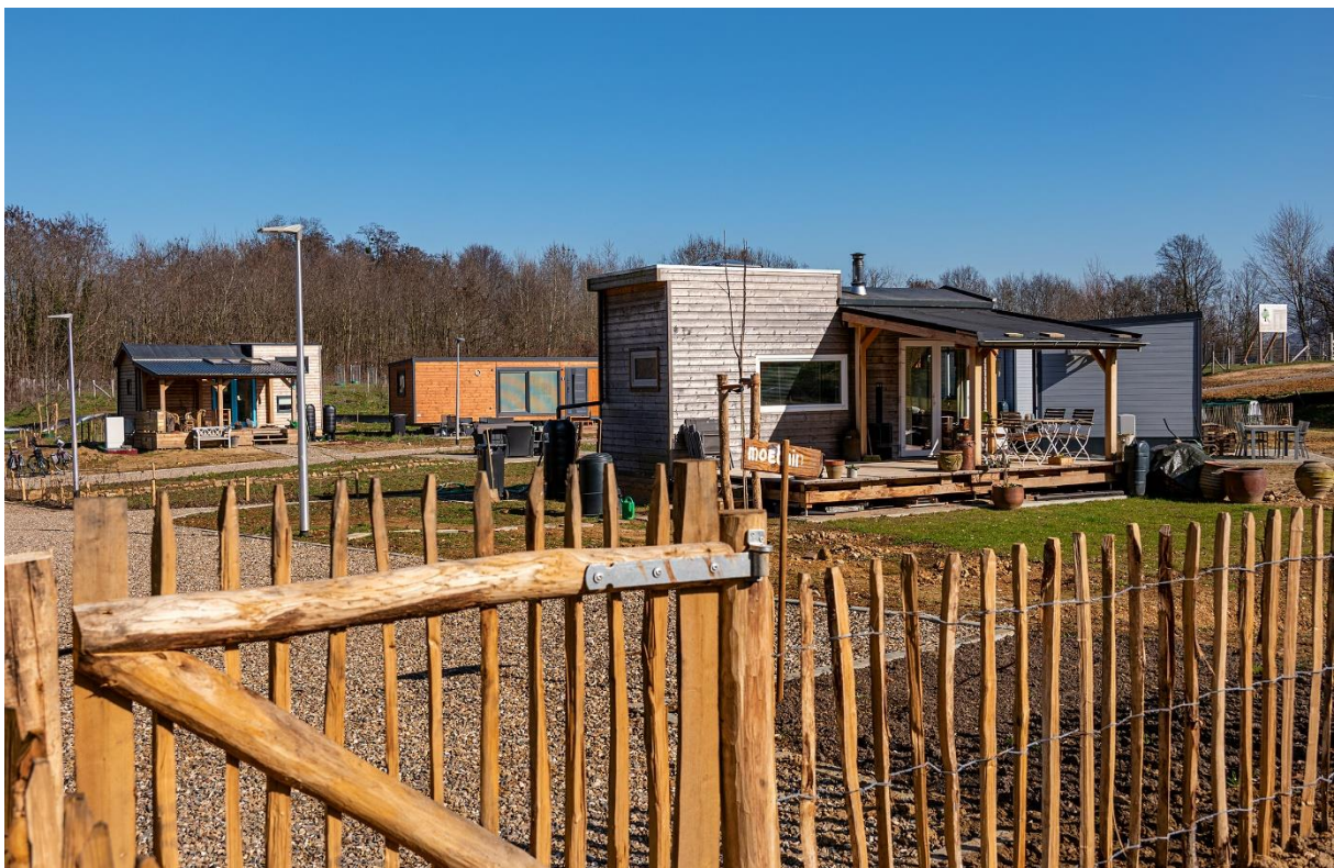
Tiny Houses in Carisborg

Gemeente Kerkrade onderzoekt met de woningcorporaties de mogelijkheden van een urgentieverordening en wacht daarvoor eerst de resultaten af van de pilot die in de naastgelegen gemeente Heerlen gestart is in 2022.